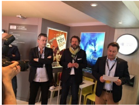
Xavier Bettel en visite à Cannes dans le cadre du 69e Festival international du film

Dernière mise à jour: 17.05.2016 (09:33)