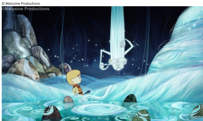
Song of the sea

Communiqué – Publié le 10.07.2015 (17:06)