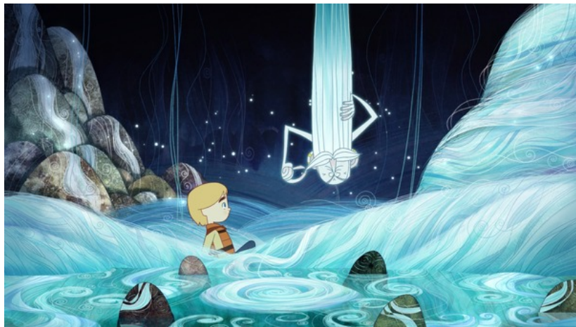
Song of the sea réalisée par Tomm Moore et coproduit par Melusina Productions

Le long-métrage d'animation Song of the sea réalisé par Tomm Moore et coproduit par Melusine Productions (Stephan Roelants) au Studio 352 à Contern est sélectionné pour l'Oscar du meilleur film d'animation par l'Académie des arts et des sciences du cinéma.